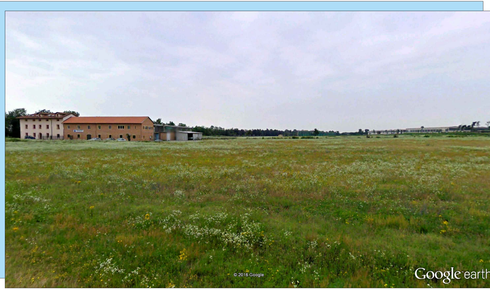
V2 - STATO DI FATTO