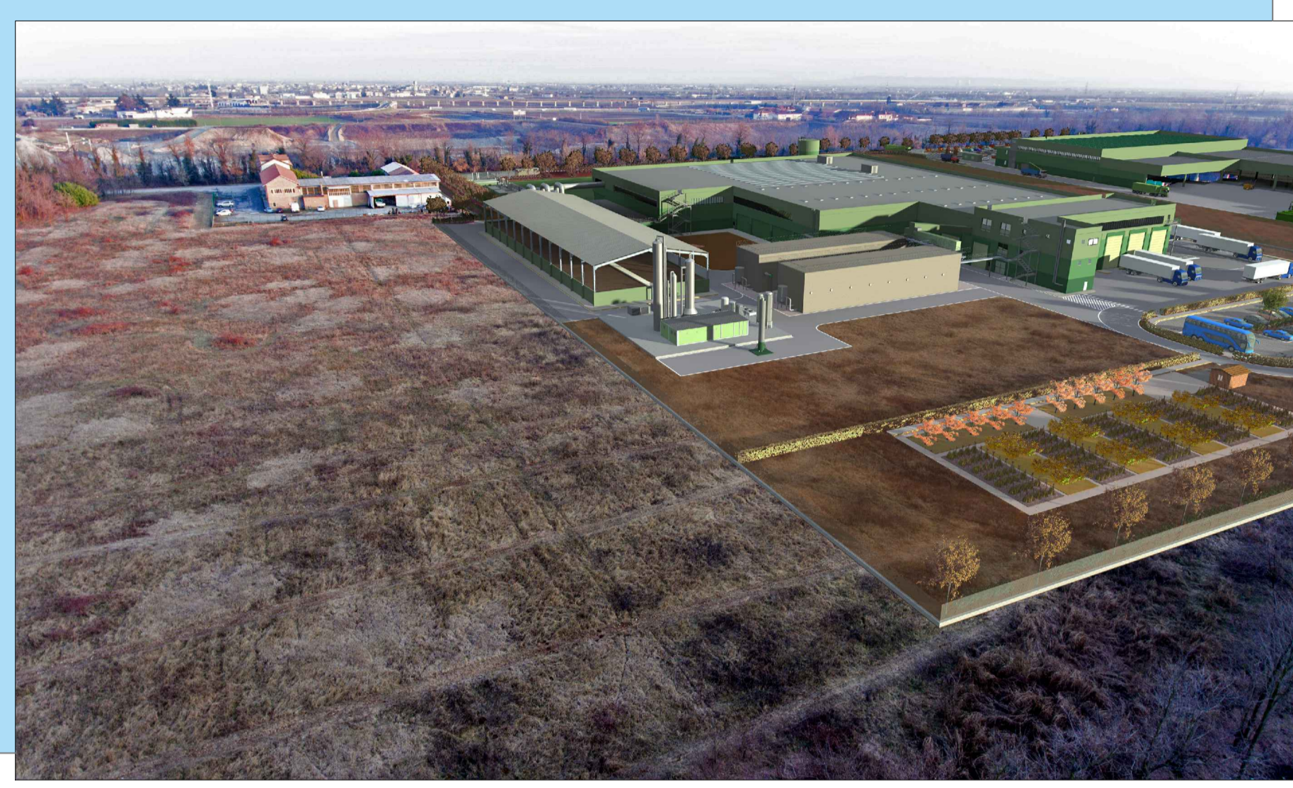
V1 - FOTOINSERIMENTO STATO DI PROGETTO