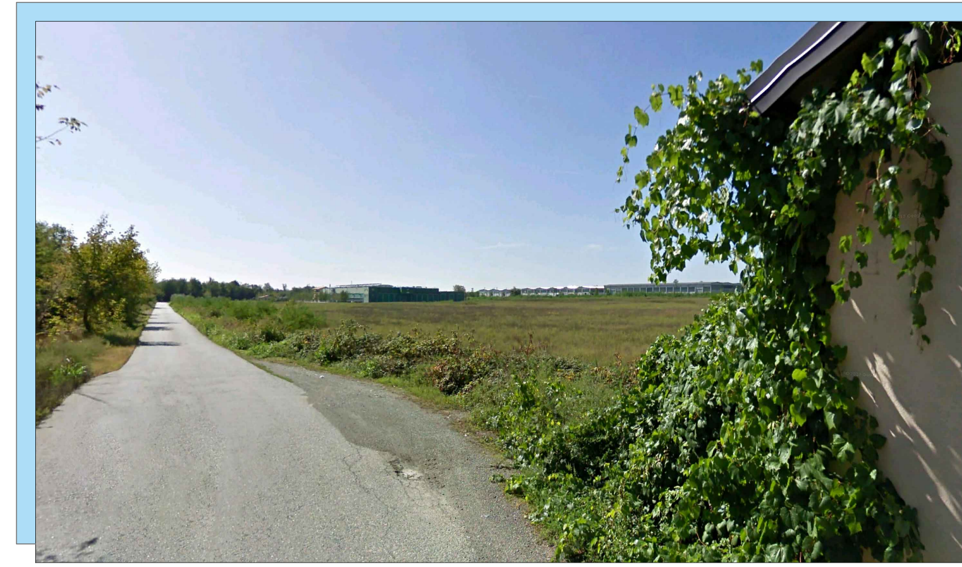
V4 - STATO DI FATTO