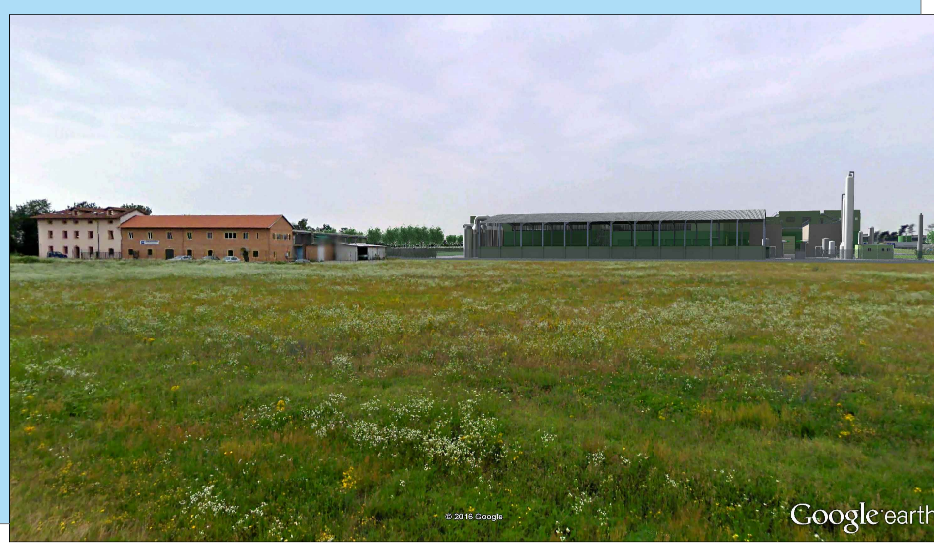
V2 - FOTOINSERIMENTO STATO DI PROGETTO