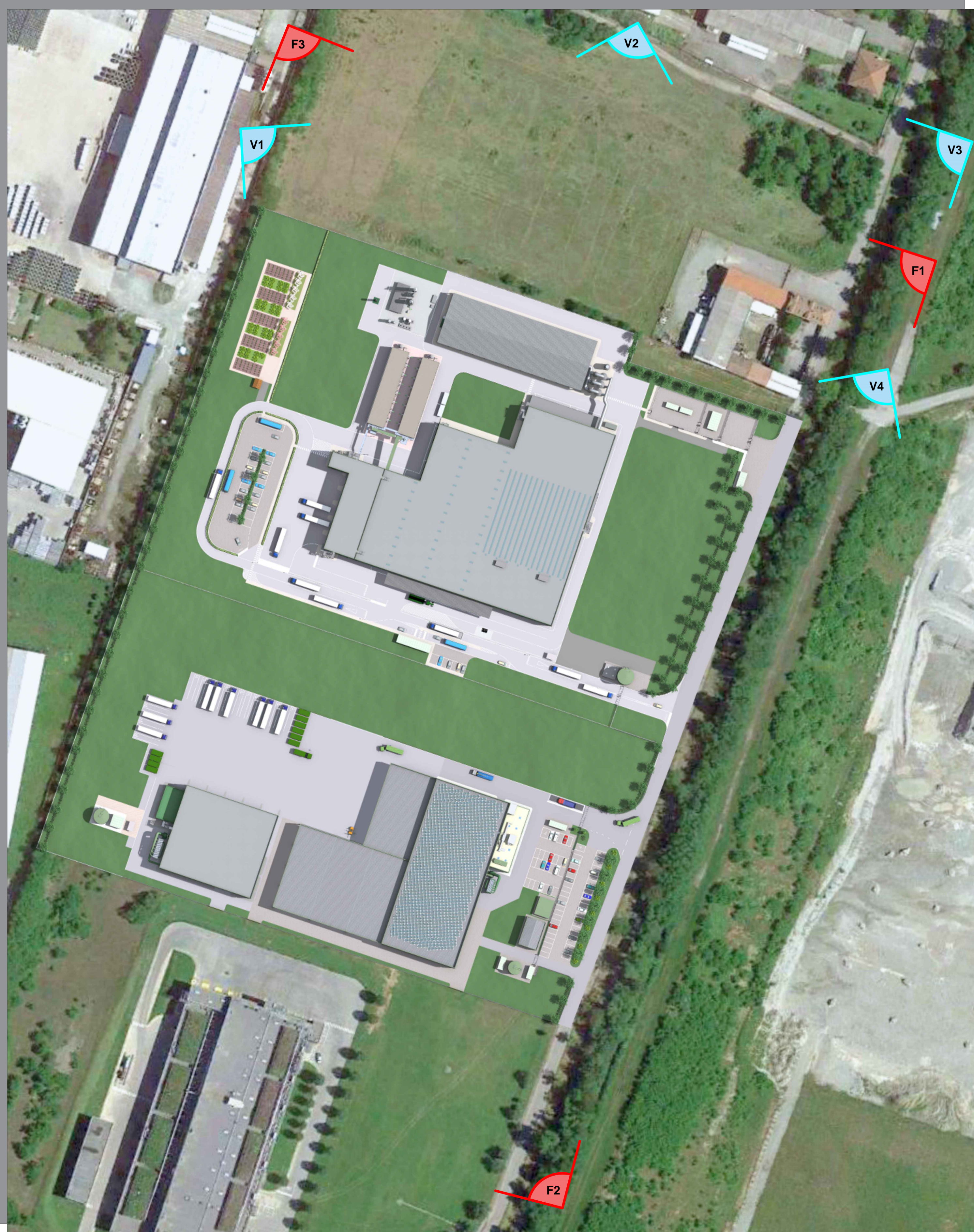
PIANTA CHIAVE FOTOINSERIMENTI