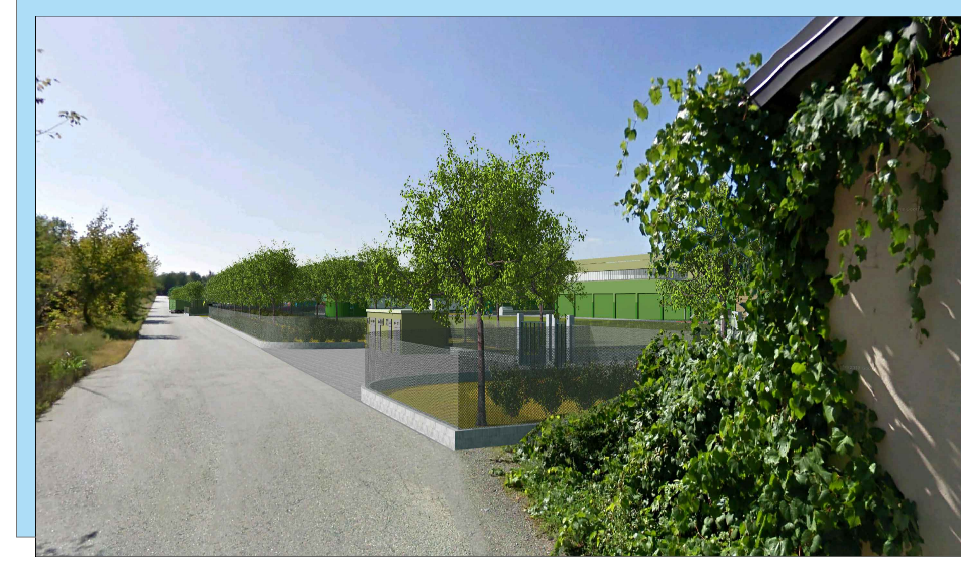
V4 - FOTOINSERIMENTO STATO DI PROGETTO