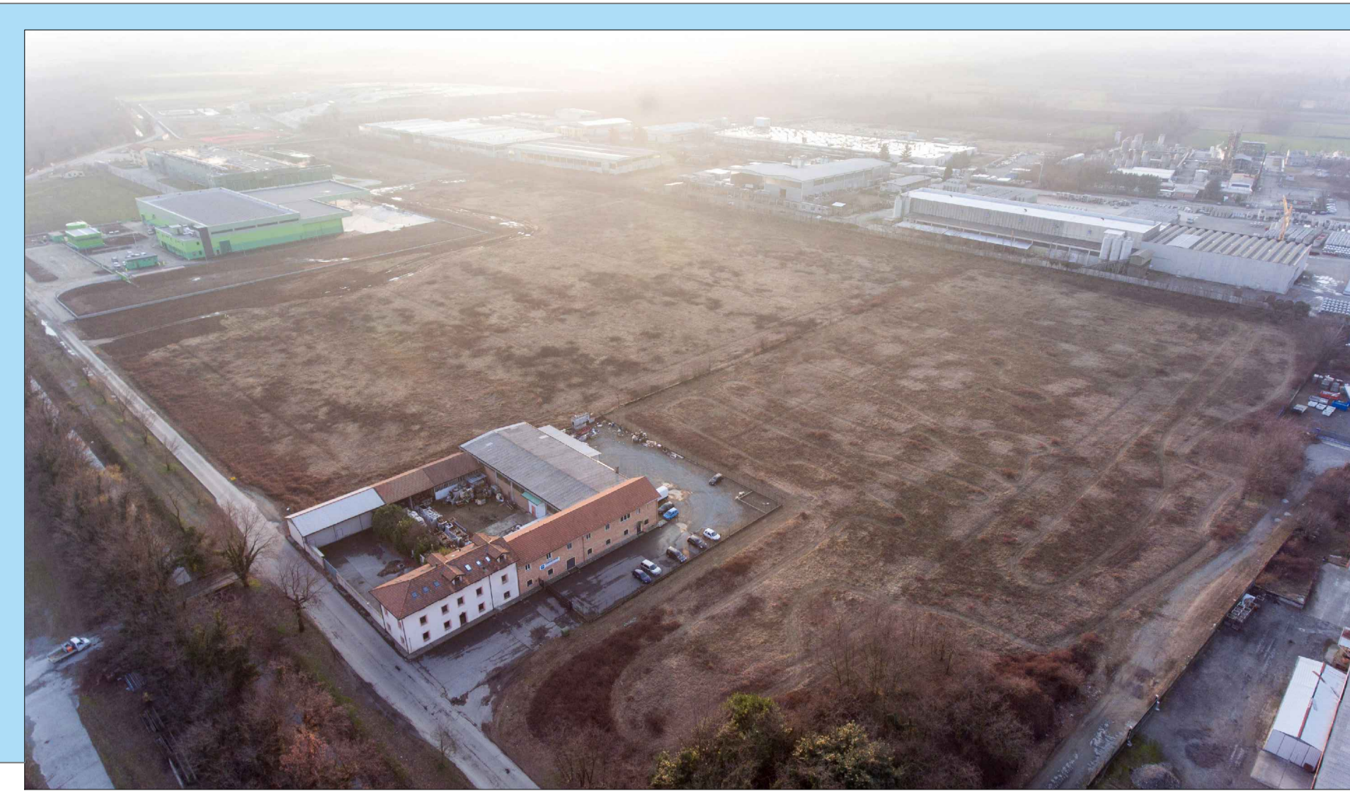
V3 - STATO DI FATTO