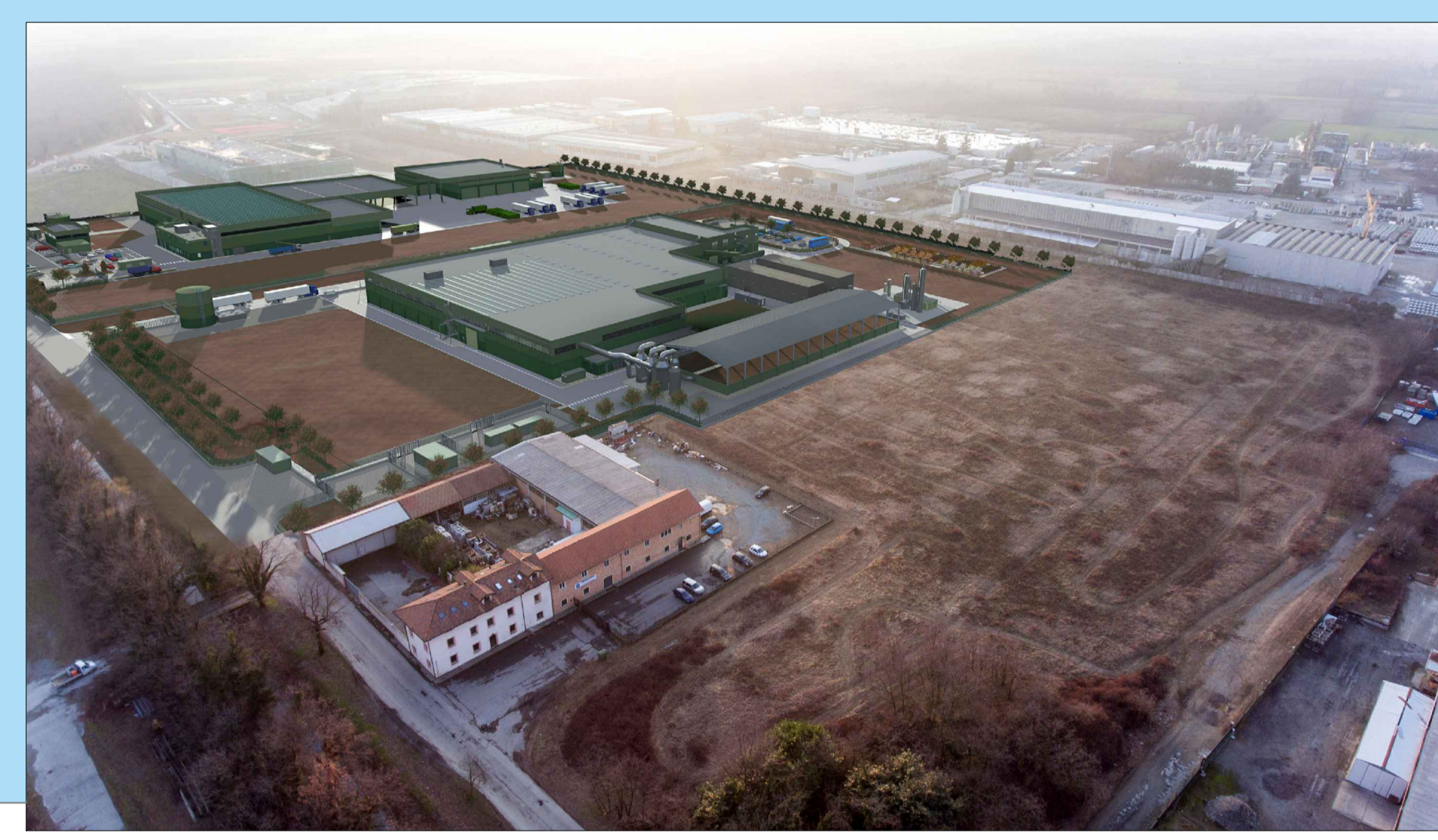
V3 - FOTOINSERIMENTO STATO DI PROGETTO