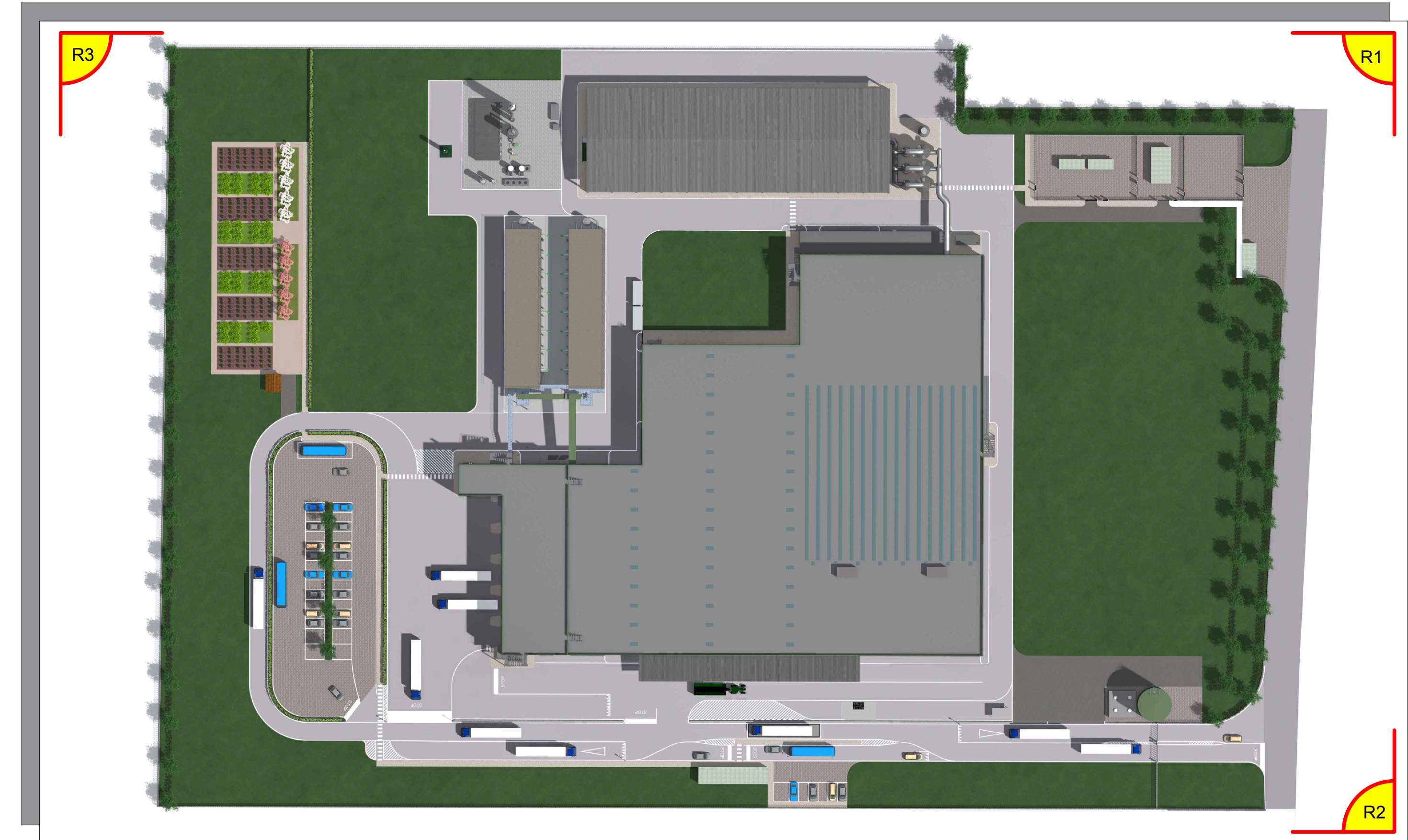
PIANTA CHIAVE RENDERING