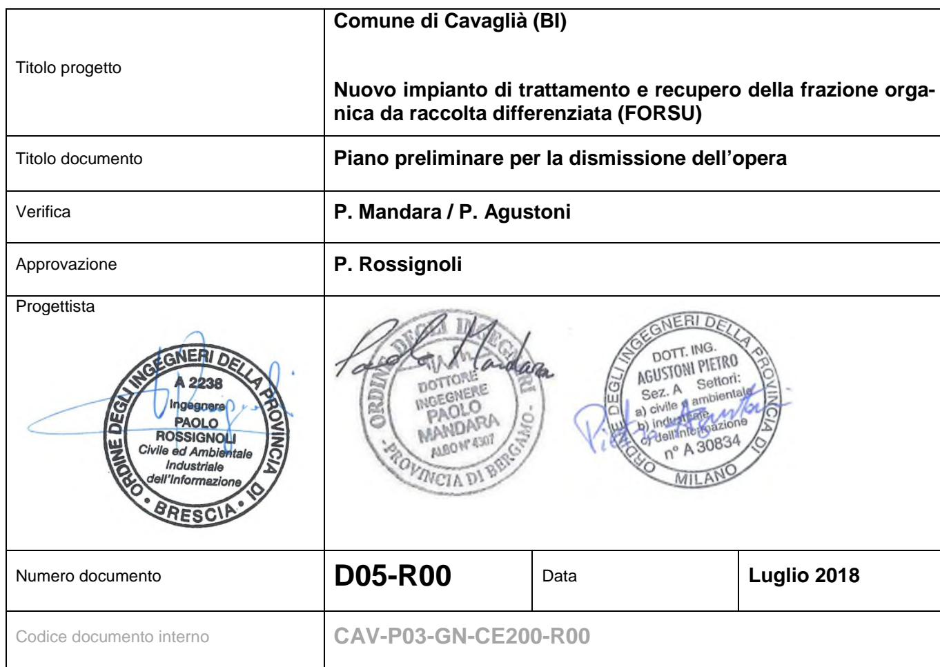
Tabella delle revisioni interne