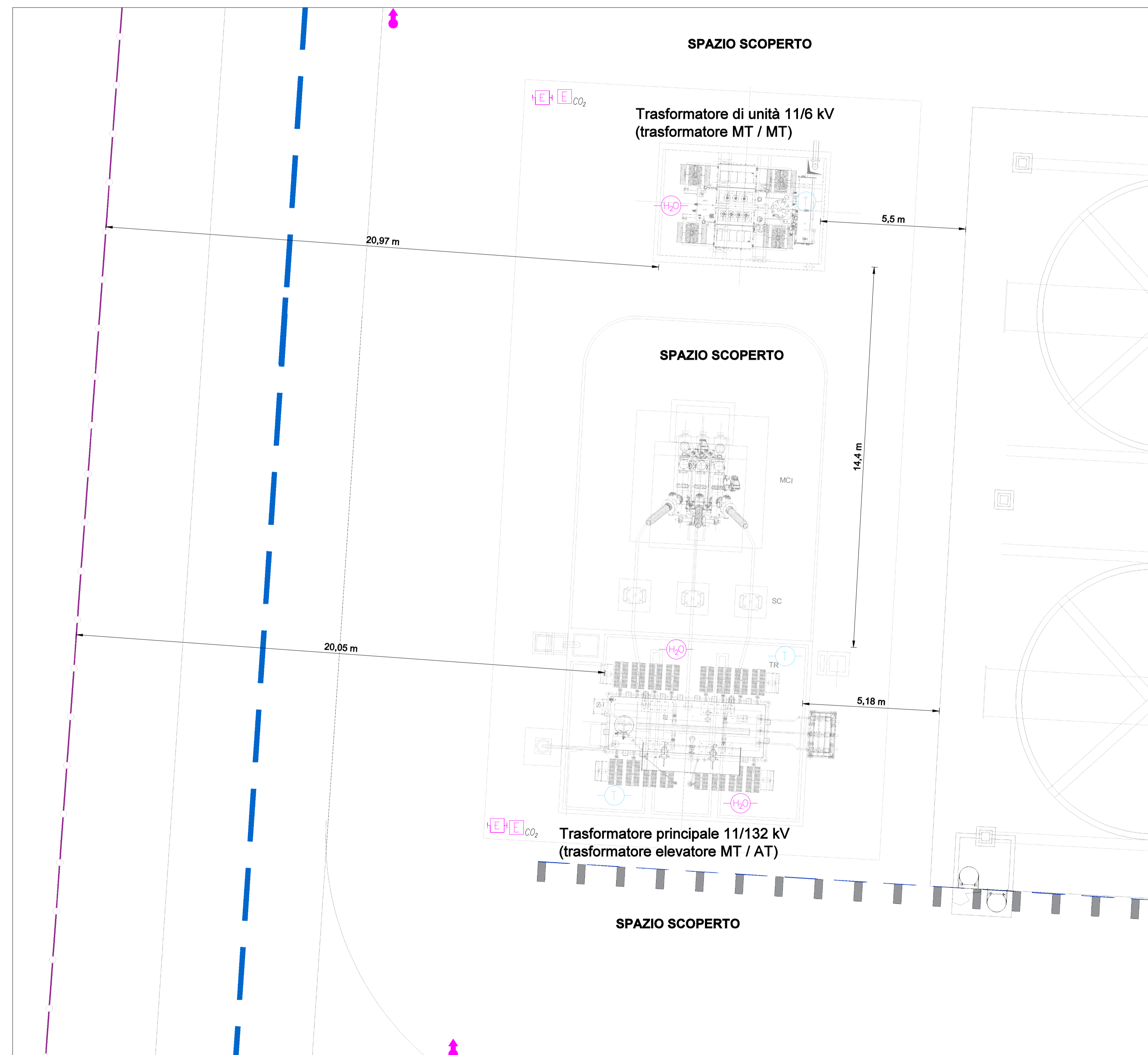
Pianta - Quota ±0,00m Scala 1:100