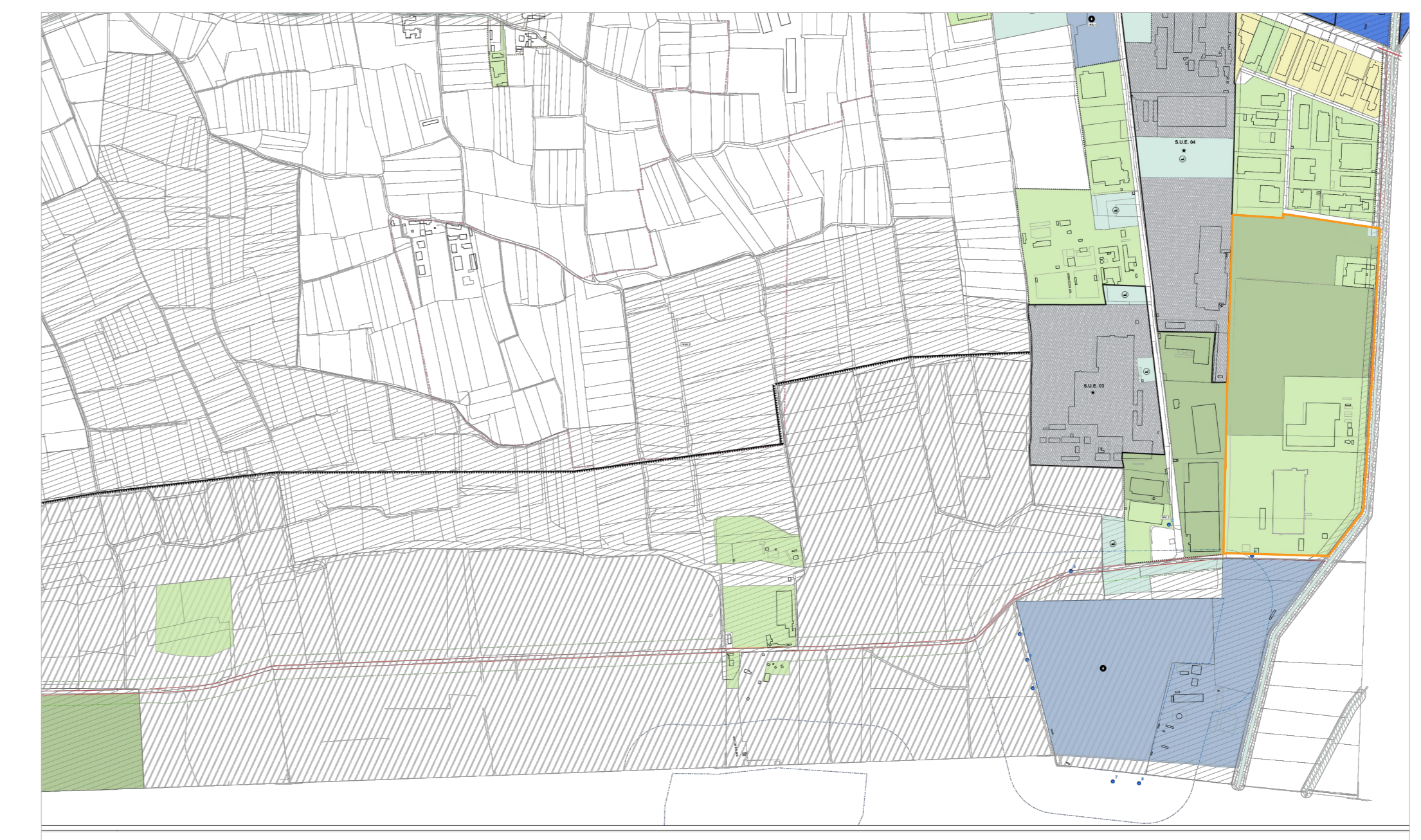
PRGc Adottato- Proposta di variante Scala 1:10000