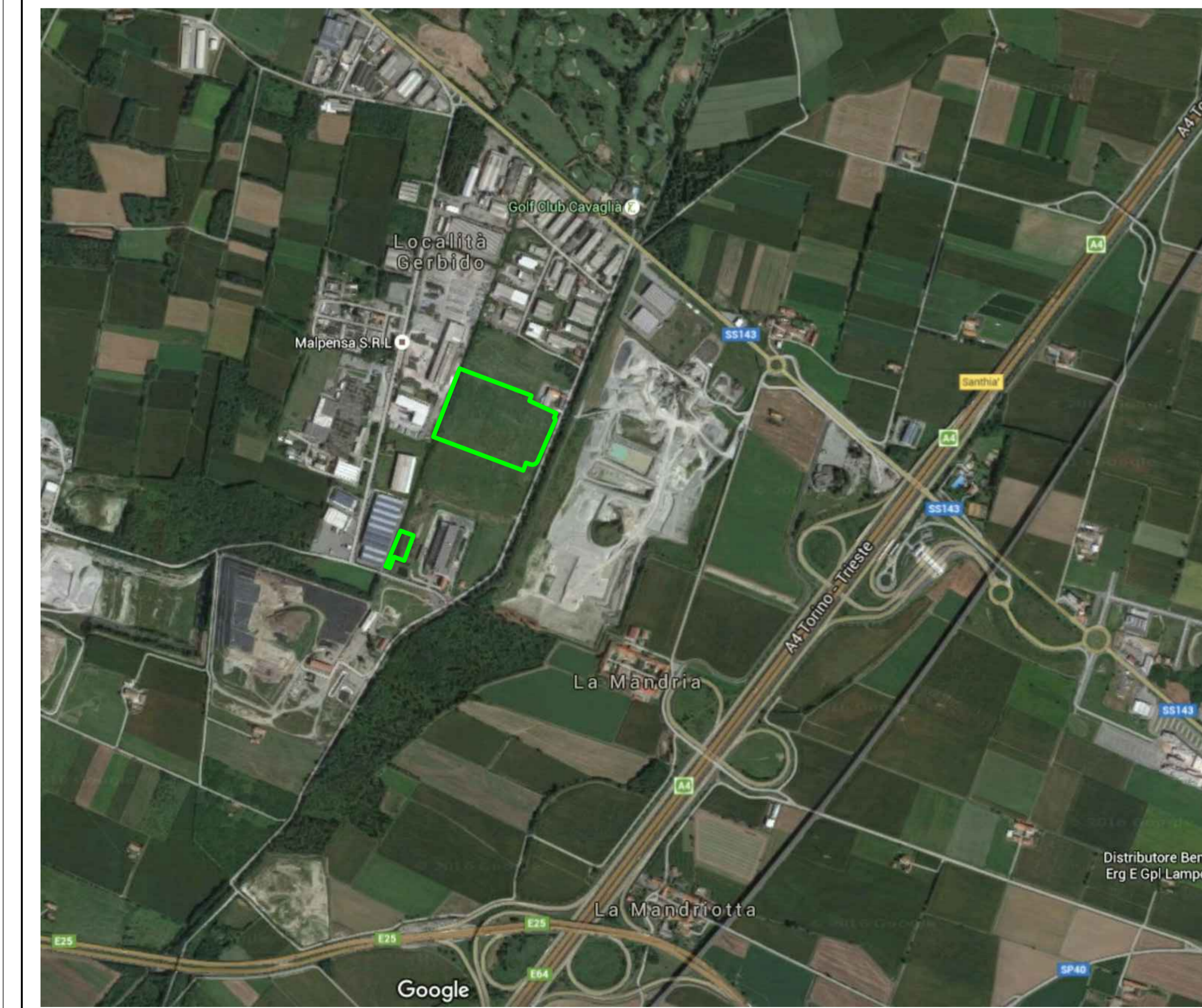
ORTOFOTO DA GOOGLE